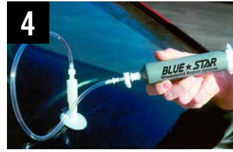
4 Aspiramento dell'aria attraverso la resina poi messa sotto pressione