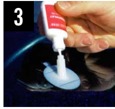
3 Posa della resina