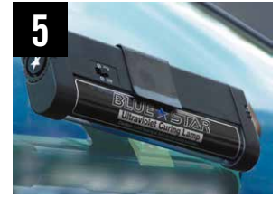
5 Polimerizzazione della resina con la lampada UV