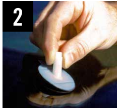
2 Posa dell'adesivo serbatoio