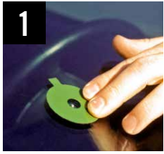
1 Posa dell'adesivo di allineamento